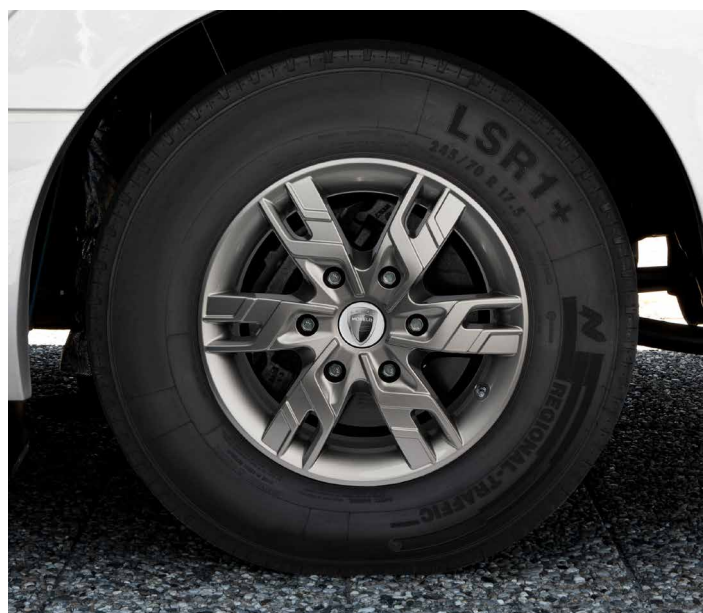
Cerchioni in metallo leggero MORELO Silver