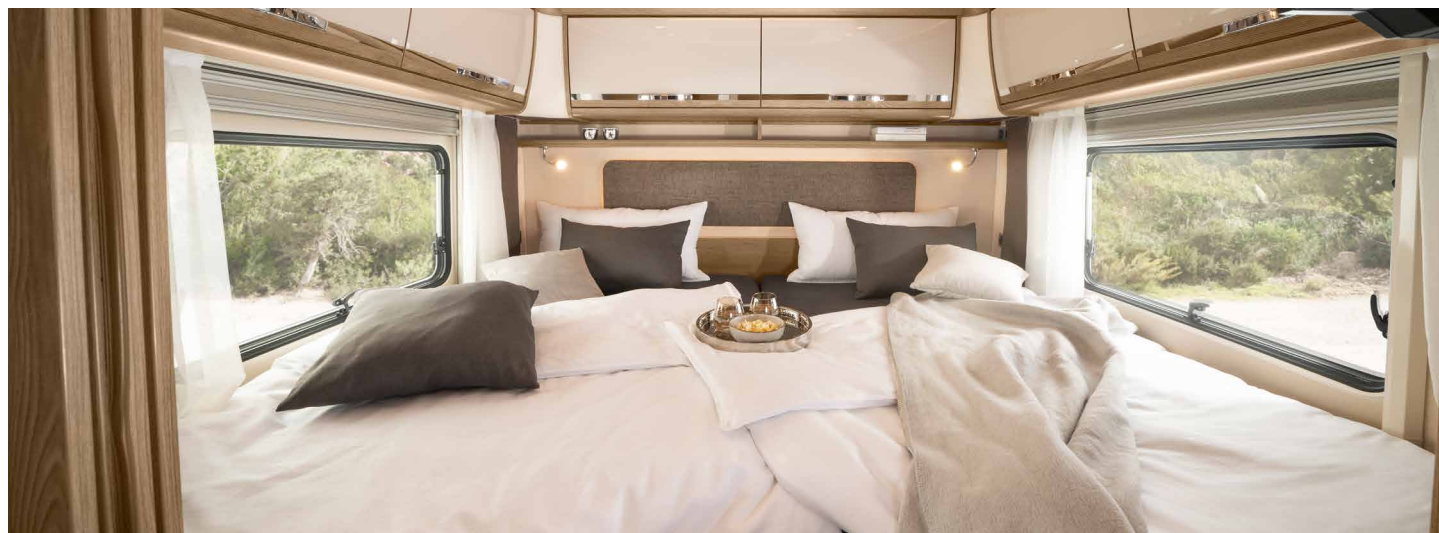
Letto con materasso multizona, incl. sospensioni comfort e testiera regolabile