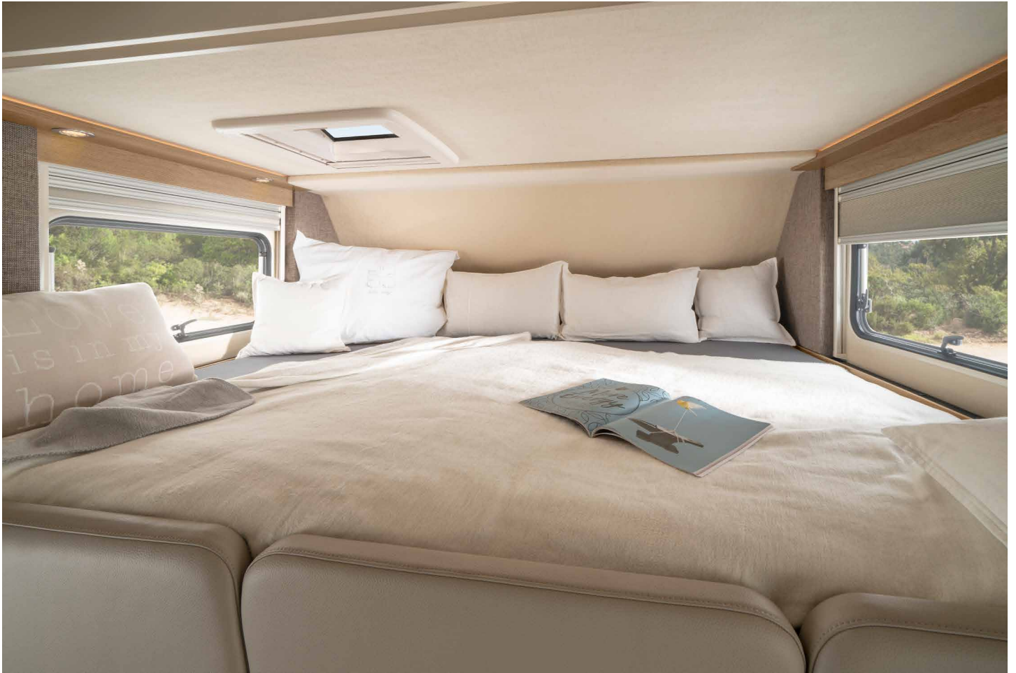
Letto mansarda a partire dal PALACE ALKOVEN 94 L