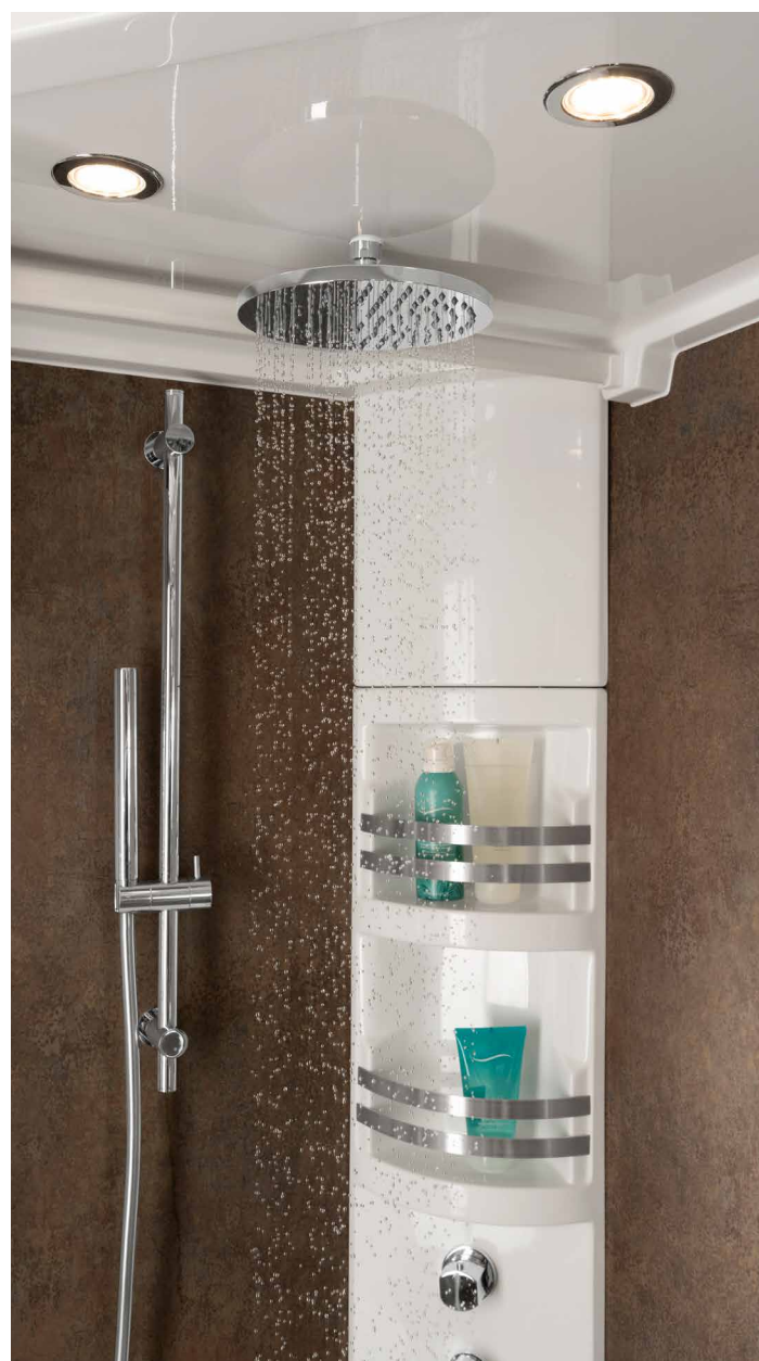
Doccia a pioggia (optional)