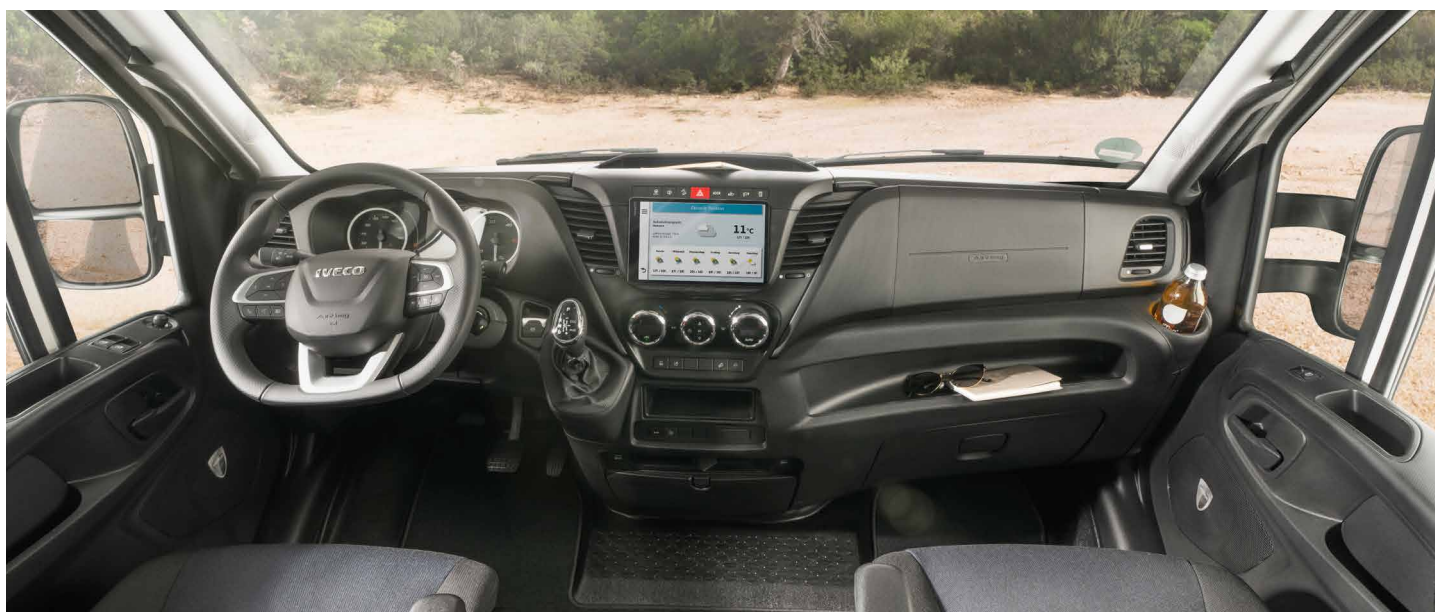
MORELO PALACE ALKOVEN cabina di guida con sistema di navigazione 8" opzionale