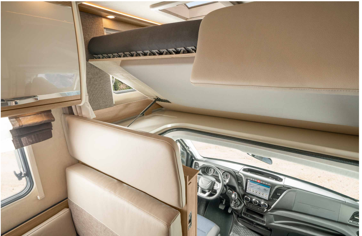
Accesso confortevole alla cabina di guida