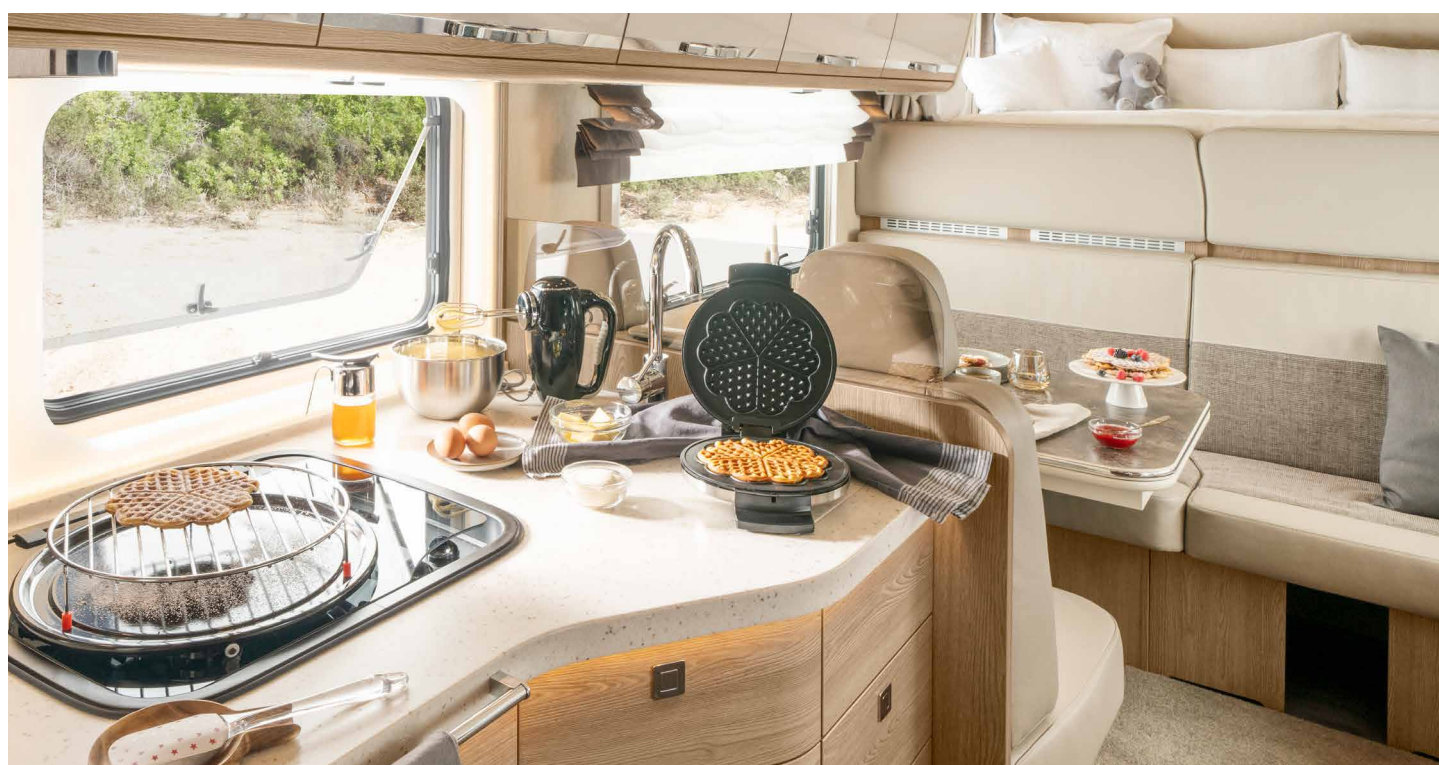
Cucina da PALACE ALKOVEN 94 L